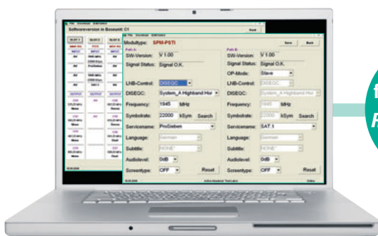
SPM 2.000 tele / tele10

Über LAN fernsteuerbar! Remote control via LAN!