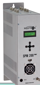
SPM 200 digi

Passendes Netzteil NG 12/3000, Artikel-Nr. 9300610 gleich mitbestellen. Order with power supply unit NG 12/3000, article no. 9300610.